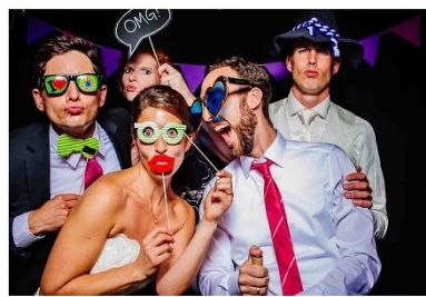
Schlicht 2 / Polaroid ähnlich