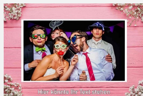
Liebe / Hochzeit 9