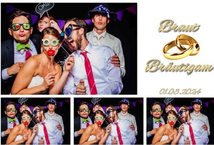
4er Abschnitt 02