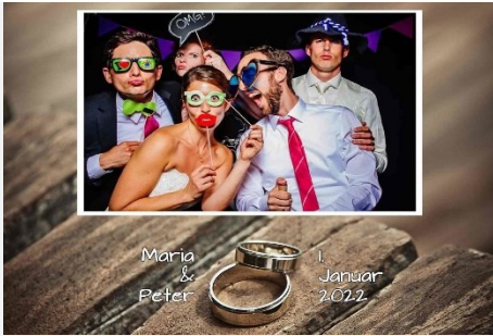
Liebe / Hochzeit 10