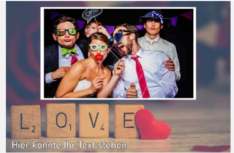
Liebe / Hochzeit 12