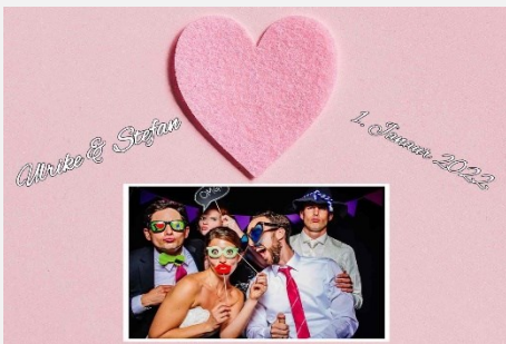
Liebe / Hochzeit 13