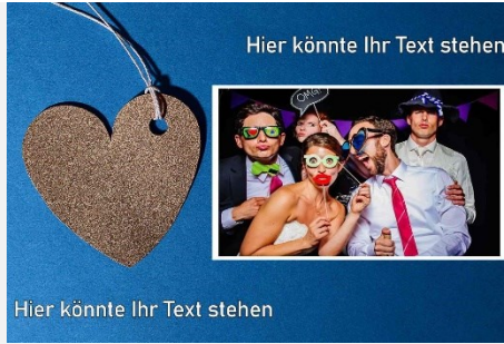
Liebe / Hochzeit 11