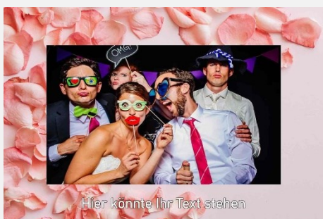
Liebe / Hochzeit 4