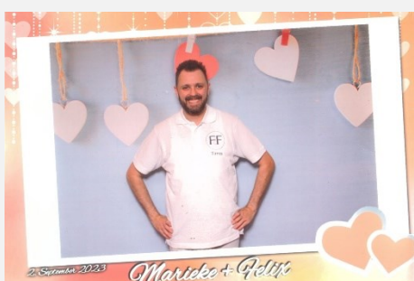
Liebe / Hochzeit 1