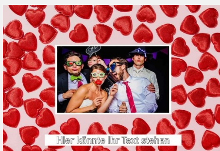
Liebe / Hochzeit 5