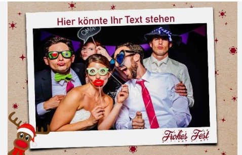
Sonstiges 3 / Weihnachten