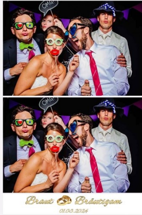
2er Abschnitt 02