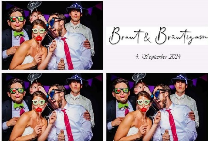
3er Abschnitt 01