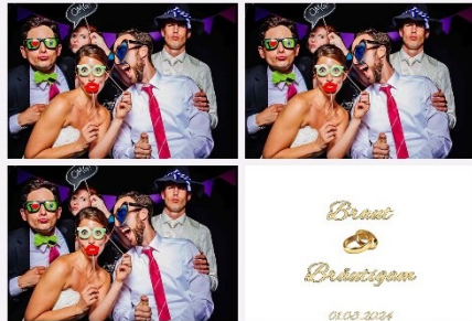
3er Abschnitt 02