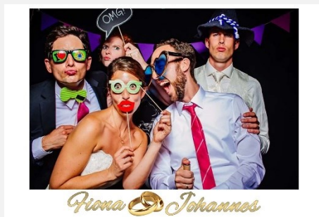
Liebe / Hochzeit 14