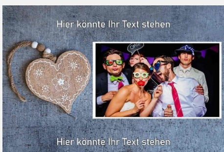
Liebe / Hochzeit 7