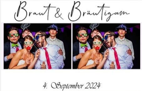
2er Abschnitt 01