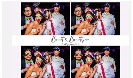
4er Abschnitt 03