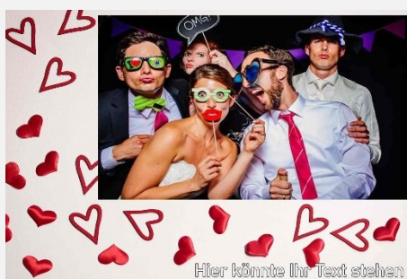
Liebe / Hochzeit 8