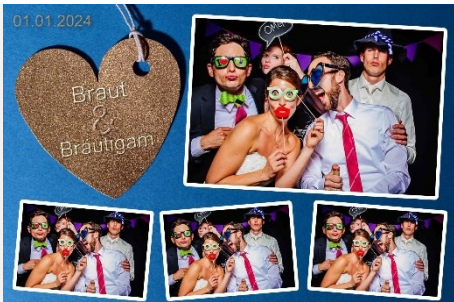
4er Abschnitt 01