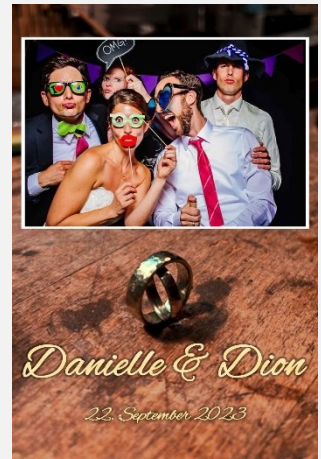
Liebe / Hochzeit 15 (hochkant)