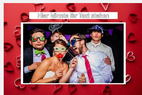
Liebe / Hochzeit 6