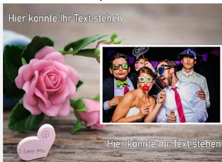
Liebe / Hochzeit 2